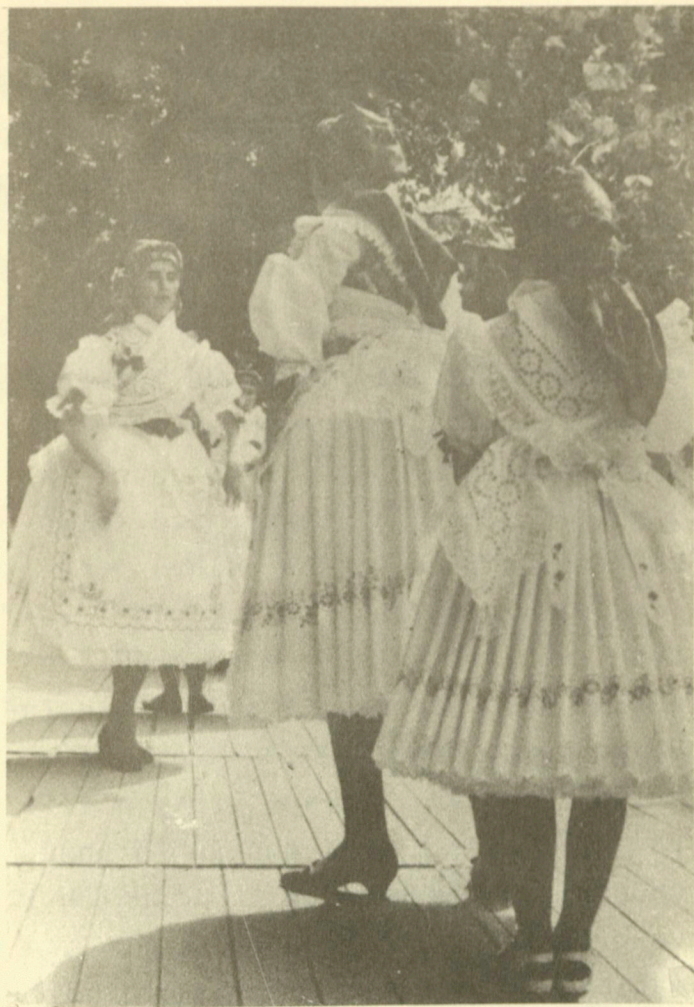
Troubské královničky v roce 1987