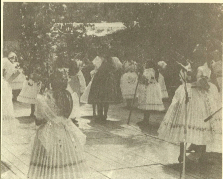
Troubské královničky v roce 1987