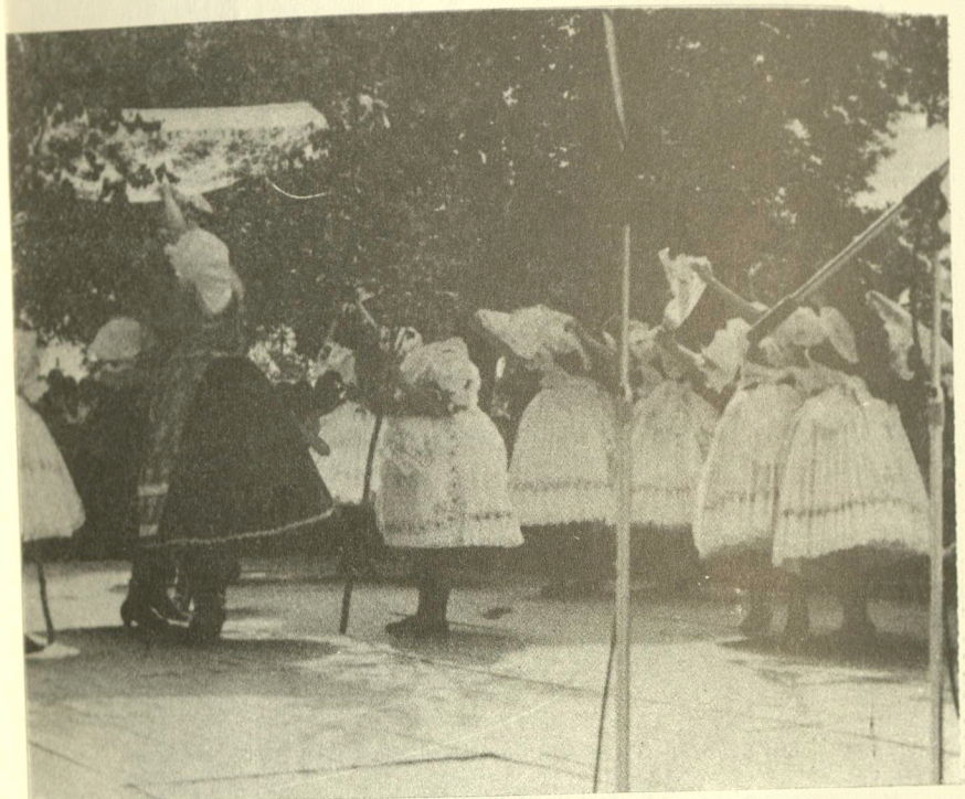
Troubské královničky v roce 1987