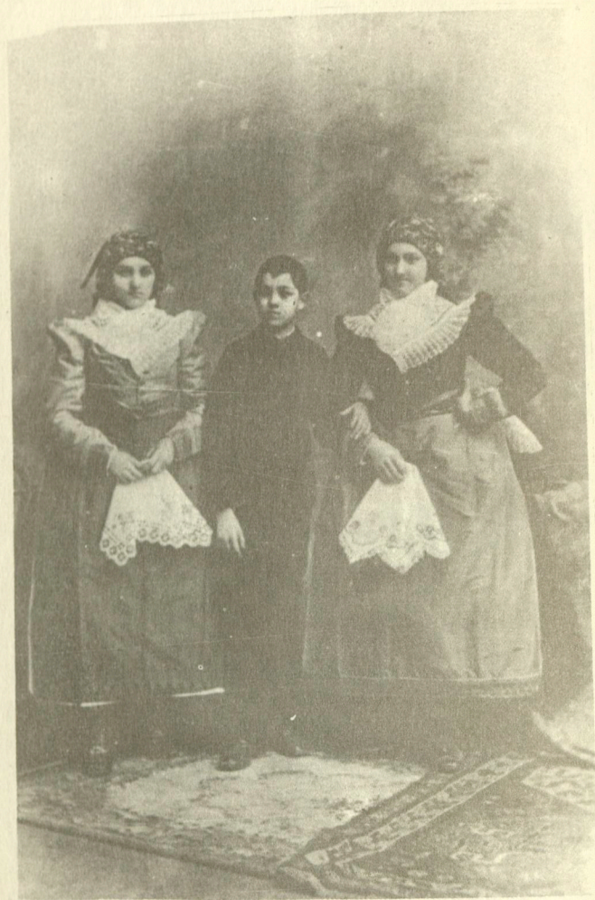
Troubské slavnostní kroje r.1897